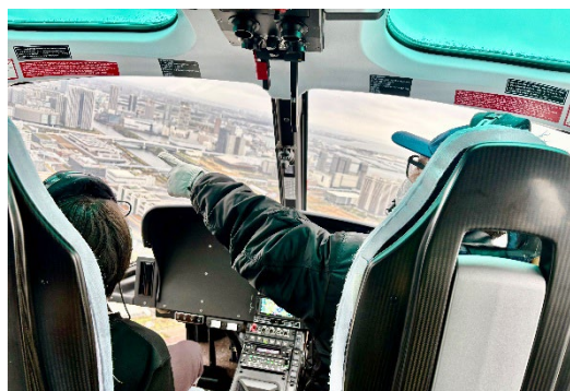
＜ヘリコプター体験フライト＞ ヘッドセットを通してパイロットと会話