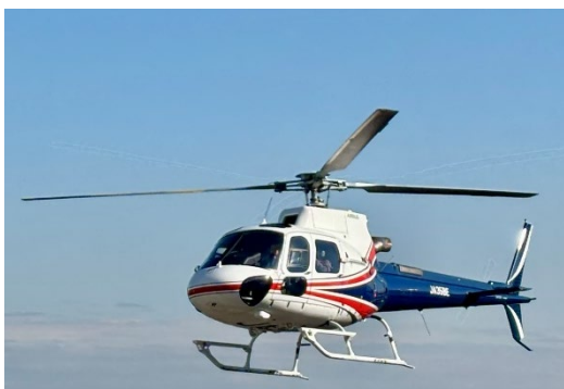
＜ヘリコプター体験フライト＞ 歓声があがる 20 分間の空の旅