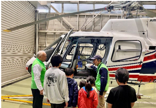
＜ヘリコプター見学＞ ヘリコプターの仕組みや安全面を学ぶ子供たち