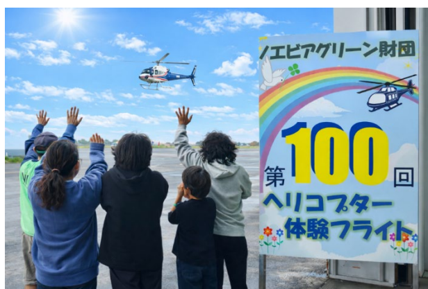
通算100回目のヘリコプター体験フライト（東京ヘリポート）

公益財団法人ノエビアグリーン財団は、2026年4月1日（水）から3日間、東京ヘリポートにて、児童養護施設やファミリーホームの子供たちを対象とした「ヘリコプター体験フライト」を開催しました。本事業は今回で通算100回目を迎え、2018年の開始以来、延べ約600名の子供たちが“空からの学び”を体験しています。当日は7歳から16歳までの22名が参加し、自分たちの暮らす街を空から見下ろす体験に歓声を上げ、目を輝かせていました。さらに、パイロットや整備士、航空管制官など空の安全を支える仕事にも触れ、自然体験や職業観を育む機会となりました。こうした体験活動の重要性を把握するため、全国の児童養護施設を対象にWEB調査 ※ を実施しました。その結果、99%が「自然体験や職業観の育成は重要」と回答し、76%が「機会不足」と回答しました。今後も未来を担う子供たちを対象とした事業を展開してまいります。次回も東京・大阪での開催を予定しています。