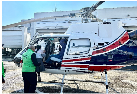
＜ヘリコプター体験フライト＞ いよいよ待ちに待ったヘリコプターに搭乗