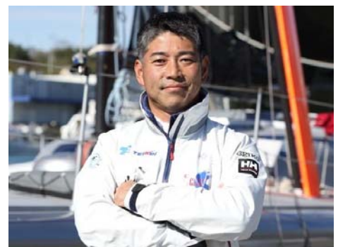
海洋冒険家・白石康次郎氏

少年時代に船で海を渡るという夢を抱き、50歳となる現在までにヨットで世界を3周以上航海してきた海洋冒険家。2016年には最も過酷と言われる単独世界一周ヨットレース「ヴァンデ・グローヴ」にアジア人として初出場を果たす。また、児童養護施設への支援活動にも長年従事しており、2014、2015年と高校生たちと共にヨットを学び、逗子ー伊豆大島間を1泊2日で往復航海する「大島チャレンジ！」を実現するなど、子供たちに自然の尊さと「夢」の大切さを伝える活動に積極的に取り組んでいる。