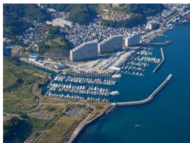
シディマリーナヴェラシス浦賀