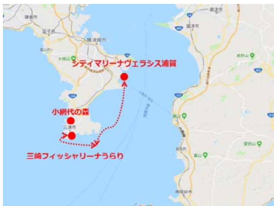
イベント実施海域