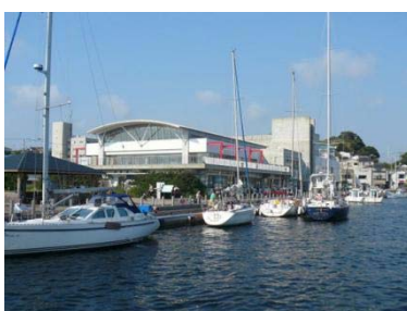
三崎フィッシャリーナうらり