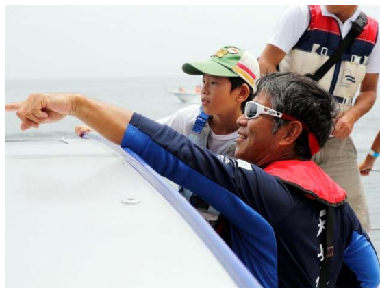
イベント実施イメージ